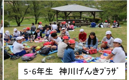
5・6年生 神川げんきプラザ