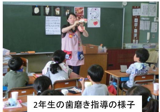
2年生の歯磨き指導の様子

田端養護教諭による歯磨き指導を全学年で実施しました。自分の歯をしっかりと磨いて自分で守っていきましょう。今年度の健康診断も6月中に終わり、治療が必要な人には治療勧告書が届いていると思います。歯の治療もその一つです。青柳小の児童憲章の中にも4番目の項目にむし歯ゼロがあります。この夏休み中に治療が必要な人は必ずお医者さんに行き治療を終えておいてください。