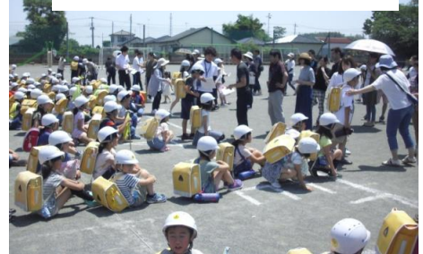
5月に実施した引き渡し訓練

台風・高潮・地震などの災害に対する認識を深め、平時の備えについて確認する日です。1923年(大正12年)9月1日に関東大震災が起きたこと、また、暦の上で台風の多い二百十日に当たることから、1960年(昭和35年)に制定されました。このことから本校でもこの日に地震による避難訓練を実施しています。