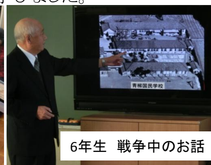
6年生 戦争中のお話