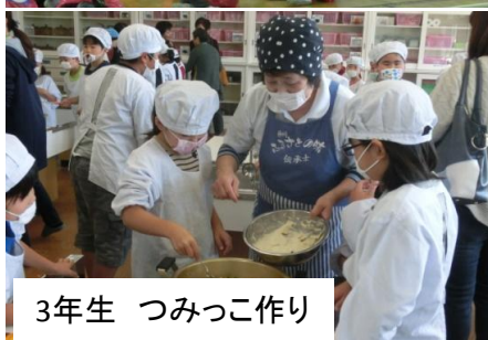
3年生 つみっこ作り