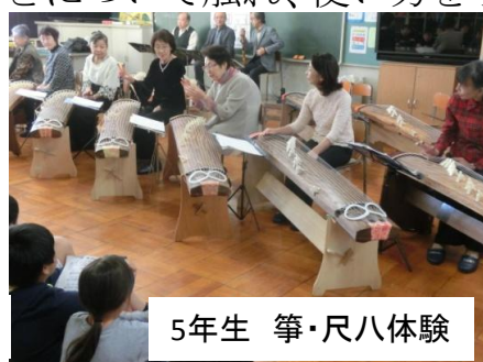
5年生 箏・尺八体験