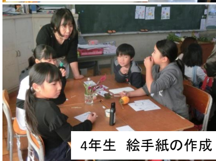
4年生 絵手紙の作成