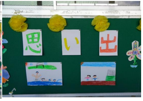
1年生作品による廊下掲示