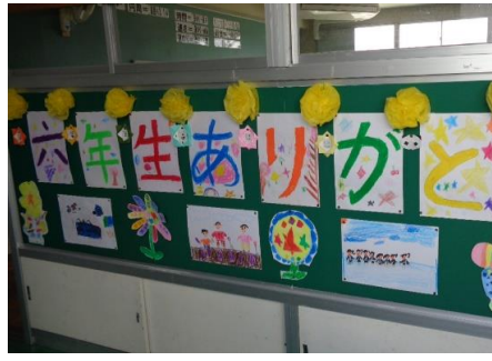
1年生作品による廊下掲示