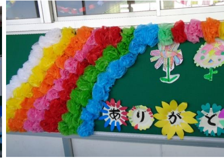
先生方による廊下掲示