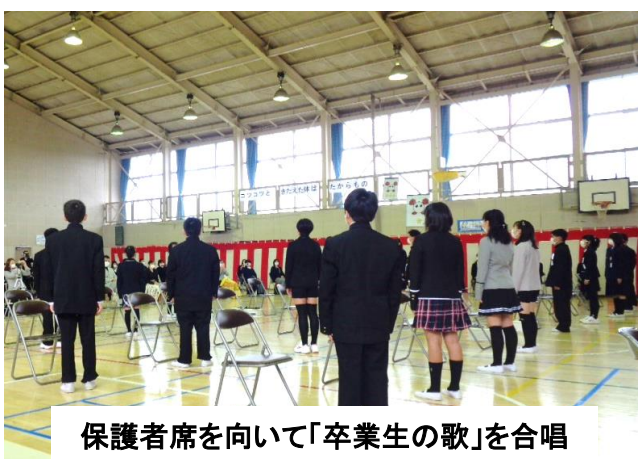
保護者席を向いて「卒業生の歌」を合唱