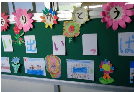
1年生作品による廊下掲示