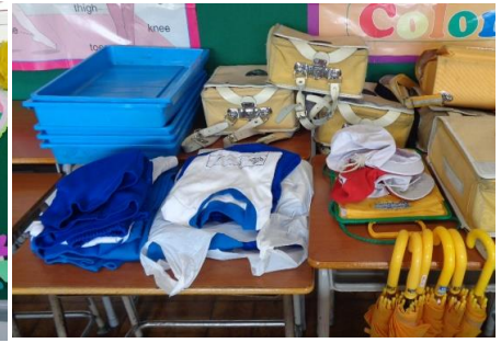
卒業生からの寄付