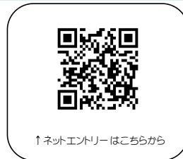
↑ネットエントリーはこちらから

振込先 銀行口座 株式会社高崎テニスクラブ 群馬銀行 高崎北支店 普通預金 1080618 ※お振込み名義は「登録番号+選手名」でご入力ください。